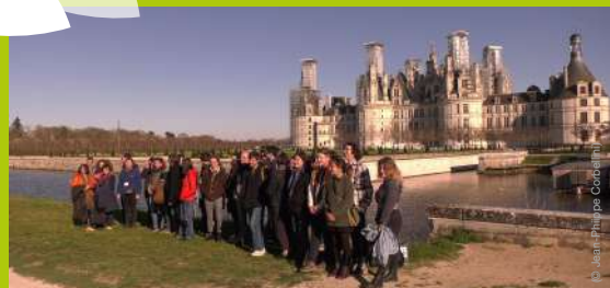
Premières Journées Doctorales de la Forêt - 4-5 avril 2023