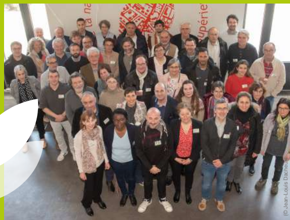
Journée Vigilance Environnementale : Détecter, Prévoir, Agir - 13 avril 2023

Au mois d'avril ce ne sont pas moins de 3 événements qui ont été organisés par le réseau MiDi. Les 4 et 5 avril, les Premières